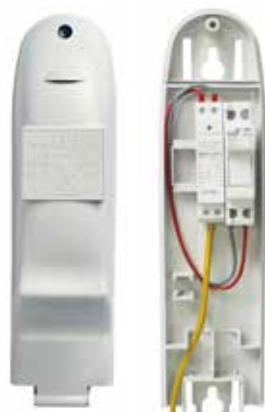
Coffret F Façade