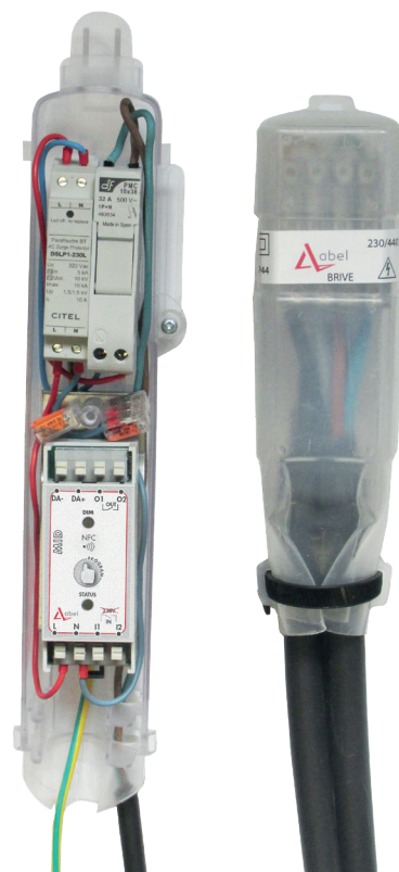
Coffret MID Junior avec parafoudre Code 101901