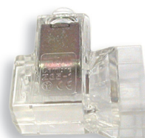
Borne de terre 2 x 16 mm 2 en option Code 100036