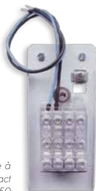
Plaquette à bornes Contact B16 - B50

Compléter la platine par une plaquette à bornes type Contact B16 - B50 (voir page 44)