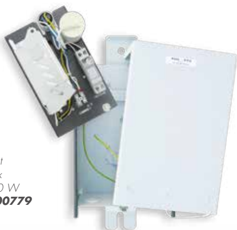
Platine en coffret VB1 inox SHP 150 W code 100779