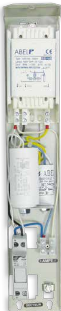
Platine classe I SHP 100 W code 100632

Compléter la platine par une plaquette à bornes type Contact B16 - B50 (voir page 44)