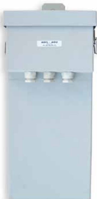
Platine en coffret tôle inox SHP 1 000 W code 100790